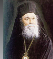
Μνημόσυνο Άρχιεπισκόπου κυρού Ίακώβου

σκοπός Χριστιανουπόλεως. Το 1936 έξελέγη Μητροπολίτης της νεοσυστα- θείσης Μητροπόλεως Αττικής και Με- γαριδος και την 13ην Ιανουαρίου 1962 Αρχιεπίσκοπος Αθηνών. Την 25ην Ια- νουαρίου 1962, αναγράσθηκε να πα- ραιτηθεί του θρόνου «ουχι οικεία βου- λή, αλλά πολλή και καταθλιπτική τη Κυ- βερνητική πέσει και πρὸς άποτροπήν ανάμειξως της Πολιτείας εις την έσω- τερικήν σύστασιν και διοίκησιν της Έκκλησίας». Μετά την παραίτησή του, διετέλεσε Πρόεδρος της Μητροπόλεως Αττικής έως της άπομακρύνσεως του το 1967. Εκοιμήθει στη Σαλαμίνα στις 25 Όκτωβρίου 1984