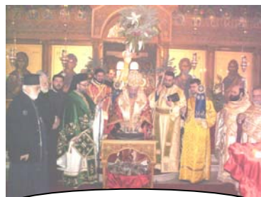
2/1/2008 Κοπή πίτας Ενορίας