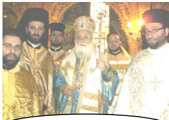
Ι.Ν.Αγ. Ευθυμίου Κυψέλης 20/1

🕯️ Την Κυριακή 13 Ιανουαρίου , λειτούργησαν στην Αγία Μαρίνα οι π. Σεραφείμ, Εμμανουήλ, Λάμπρος & Βασίλειος ενώ στον Άγιο Νεκτάριο ο π. Ιωάννης. Την Κυριακή 20 Ιανουαρίου , λειτούργησαν στην Αγία Μαρίνα ο Αρχιμ. π. Γρηγόριος Μηλιάρης, εκ Βεγγάζης της Λιβύης, ο Σύγκελος π. Σεραφείμ Καλογερόπουλος εκ Δημητσάνης, & ο π. Λάμπρος ενώ στον Άγιο Νεκτάριο ο π. Ιωάννης Ο π. Σεραφείμ, συλλειτουργός του εορτάζοντος Σεβασ. Μητροπολίτου Αχελώου κ. Ευθυμίου, στον Άγιο Ευθύμιο Κυψέλης & ο π. Βασίλειος στην Κορινθία για οικογενειακό Μνημόσυνο. Ο π. Σπυρίδων και 13 & 20/1 βρισκόταν στο Μάντσεστερ του Ηνωμένου Βασιλείου.