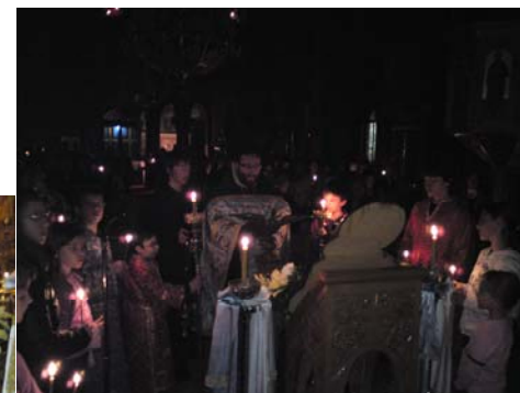
✠ Ακάθιστος Ύμνος προ αντιγράφου της Παναγίας της Οστρομπράμσκας