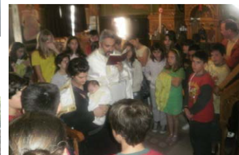
✠ Θ. Λειτουργία στα 3 ο & 16 ο Δημοτικά Σχολεία 14/6 όπως έγινε & στις 11/6 στο 12 ο Έθος πια στη λήξη της χρονιάς.