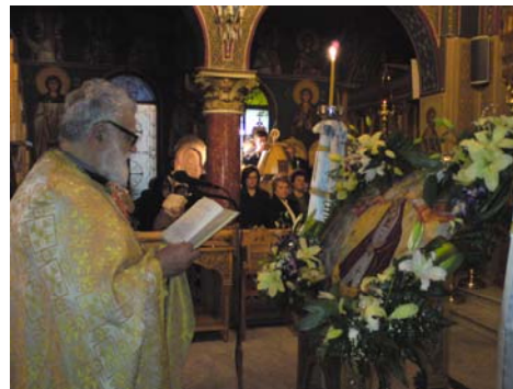
Σχολικό τμήμα παρακολουθεί στο Ναό Σαραντισμό βρέφους ✠

Τελούσαμε & βραδινή 3 η ακολουθία χαιρετισμών της Θεοτόκου μέσα στον φωτισμένο μόνο από τα κεριά Ναό ✠